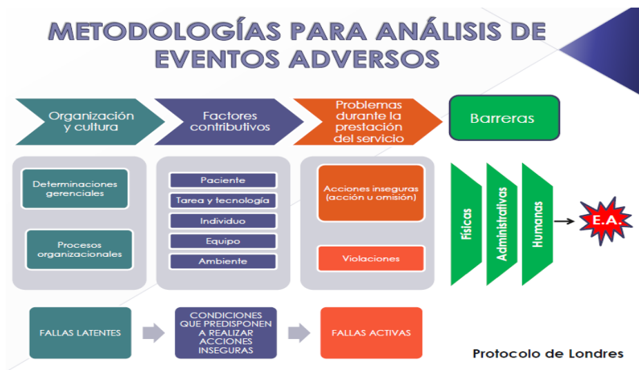
Figura 2. Protocolo de Londres

Cada Prestador de Servicios de Salud es autónomo en elegir la herramienta de análisis de los eventos e incidentes adversos (SHELL, ANCLA, Causa Raíz, etc) para la evaluación de cada uno de los casos.